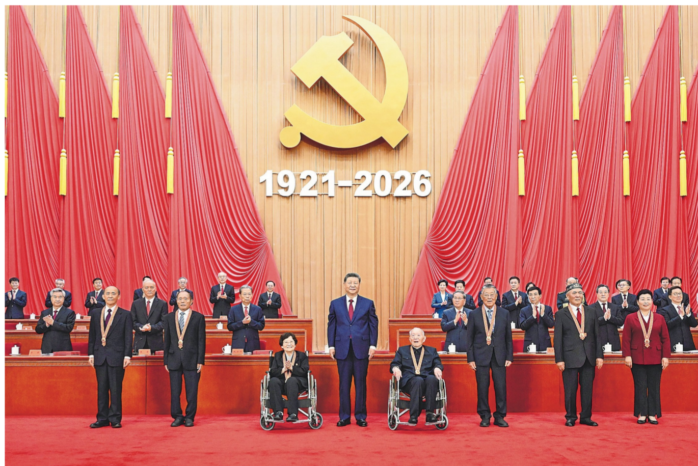
7月1日上午,庆祝中国共产党成立105周年大会在北京人民大会堂隆重举行。中共中央总书记、国家主席、中央军委主席习近平向“七一勋章”获得者颁授勋章。新华社记者 申宏 摄

新华社北京7月1日电 庆祝中国共产党成立105周年大会7月1日上午在北京人民大会堂隆重举行。中共中央总书记、国家主席、中央军委主席习近平向“七一勋章”获得者颁授勋章并发表重要讲话。他强调,105年来,我们党始终坚守为中国人民谋幸福、为中华民族谋复兴的初心使命,在不懈奋斗中创造了彪炳史册的伟大成就。新征程上,全党同志要坚定信心、接续奋斗,不断创造无愧于时代和人民的新业绩。 中共中央政治局常委李强、赵乐际、王沪宁、蔡奇、丁薛祥、李希、国家副主席韩正出席大会。 上午9时许,“七一勋章”获得者集体乘坐礼宾车从住地出发,由礼宾摩托车队护卫前往人民大会堂。人民大会堂北门外,礼宾分列道路两侧,青少年热情欢呼致敬。“七一勋章”获得者沿着红毯拾级而上,进入人民大会堂。党和国家功勋荣誉表彰工作委员会有关领导同志等,在这里集体迎接他们到来。