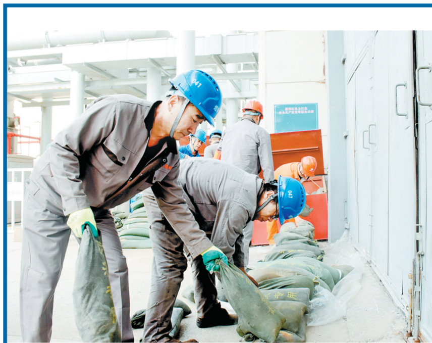
6月18日,山东蓬莱公司组织开展防汛综合应急演练。参演人员快速装填沙袋、疏通积水、处置设备险情,紧扣汛期“三防”要点,以实景实操锤炼抢险技能,筑牢机组汛期安全运行防线。图为参演人员在汽机房北门堆放沙袋。

山河作证,情满米脂。从2002年至今,集团公司与米脂县携手并肩,共同见证了这片土地从贫困走向振兴的深刻变迁。如今的米脂,正展现出山清水秀、产业兴旺、人民幸福的崭新面貌。站在新起点,集团公司将继续践行央企责任,围绕米脂县乡村振兴实际需求,持续优化帮扶举措,在生态保护、产业升级、民生改善、人才培养等领域深化合作,助力巩固拓展脱贫攻坚成果,推动乡村全面振兴不断迈上新台阶。