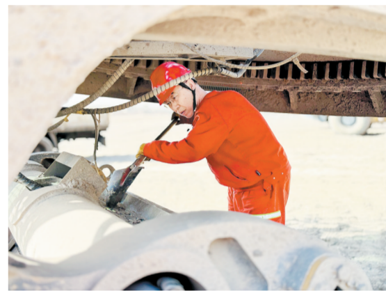
6月以来,准能集团黑岱沟露天煤矿加强防汛设备维护,完成刮路机、装载机保养;组织防汛应急演练,调度设备清理淤泥、修复路面,全力保障“安全生产月”期间运输安全畅通,筑牢度汛防线。图为6月17日,平路机司机清理工作装置积土碎石。