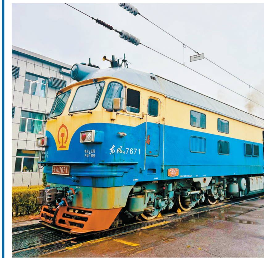
进入汛期以来,包神铁路机务分公司管内区域强降雨天气频发,铁路运输安全风险持续攀升。为筑牢西煤东运能源运输大动脉安全屏障,该分公司坚持关口前移,紧盯机车部件安全与库区现场防护两大关键,聚焦机车检修质量追溯,库区全域防汛巡检两项核心工作,提前部署、精准施策,全面打好防汛减灾主动仗,保障汛期机车运用安全与铁路运输秩序稳定。图为6月22日,职工进行检修机车交验作业。