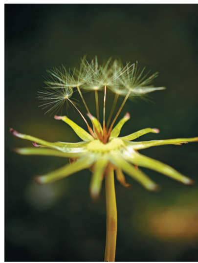
残絮待风

长焦镜头抓拍躲在树后的小橘猫,它正支棱着尖尖的耳朵,一双狐疑的眼眸静静打量着我。挺翘的雪白胡须,仿佛在细细丈量我的身形;粉嫩小巧的鼻尖微微翕动,似在悄然捕捉我的气息,一举一动,满是小翼翼的警觉与灵动。