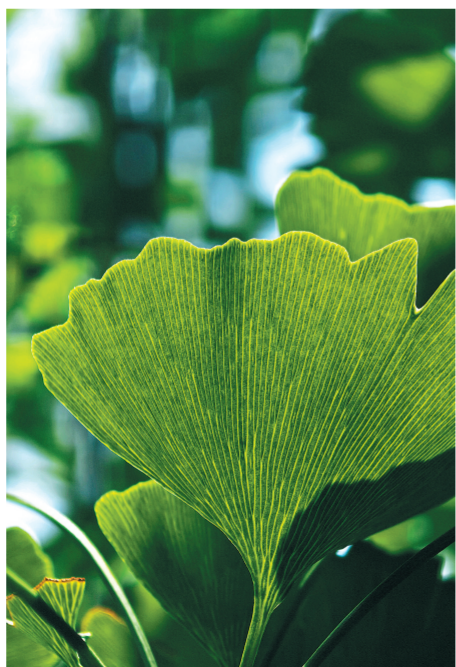
晴日青痕

红底缀黑斑的小瓢虫静栖翠叶,明艳鲜亮的身姿融于青绿之间,格外灵动夺目。它恰似一枚小巧璀璨的红星,悄然点缀枝头绿意,点亮微观世界的盎然生机。