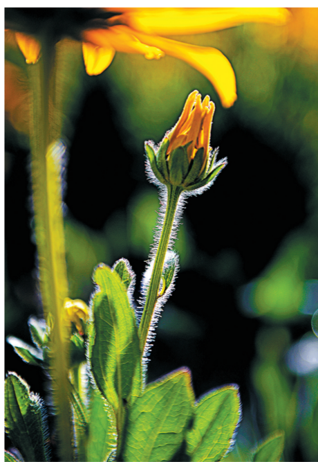
新生 裴振喜 摄

日光细细雕琢银杏叶,规整细密的放射状脉络舒展分明。扇形碧叶层层错落,明暗光影温柔交织,细腻勾勒出古老树种独有的自然肌理,尽显浑然天成的姿态与生机。