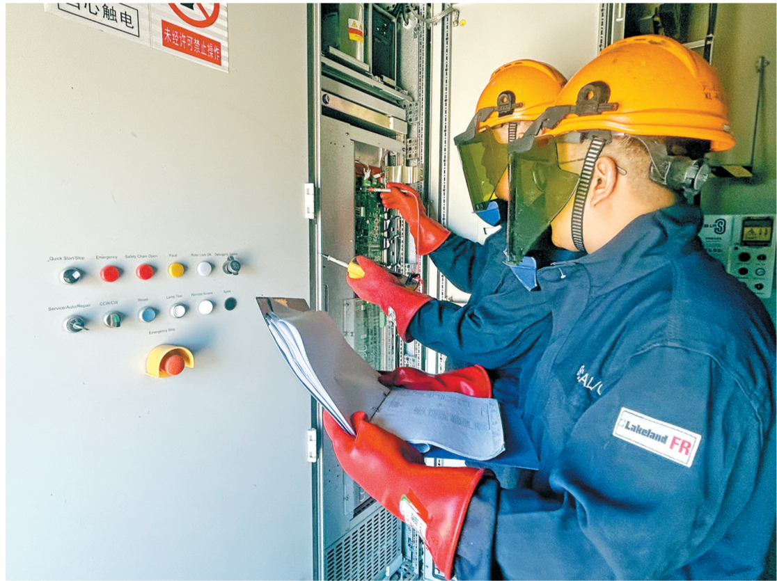
↑ 龙源电力吉林公司持续强化现场作业管控,规范作业流程。运维人员严格执行安全作业规范与“安全监护、按票作业”要求,对高压电气设备开展检测,以严谨细致的态度和标准化作业筑牢安全生产防线。图为5月9日,职工对变频器进行防护设备检测。

本次活动特邀北京知名中医医院10余名专家及医护人员组成义诊团队,现场提供中医问诊、按摩推拿、眼部护理、体检报告解读、健康咨询等一站式服务。义诊现场秩序井然,气氛热烈,前来咨询就诊的职工络绎不绝,医护人员耐心细致地为职工把脉问诊、检查身体,针对常见职业病、慢性病、亚健康等问题逐一分析解答,量身定制调理方案与治疗建议,并面对面普及科学防病、合理膳食、科学养生等健康知识,把专业、贴心、实用的健康服务送到职工身边。此次活动共接诊职工60人次,提供健康咨询30余人次,实用贴心的服务得到干部职工的一致好评与广泛赞誉,切实提升了职工的获得感、幸福感与归属感。