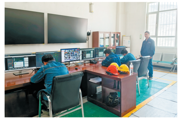
近日,新疆阿克苏公司组织开展技能水平检验考试,对运行人员的应急处置、规范操作、制度掌握等能力进行全面摸排,创新构建“基础理论+规范操作+应急处置”三位一体的全链条考核体系,为后续精准培训、能力提升锚定方向。图为考试现场。

德润人心,行稳致远。辽宁热力将持续深耕“道德讲堂”建设,让道德之光点亮前行之路,让文明之风浸润职工心田,为守护万家温暖、助力社会进步贡献国能力量。