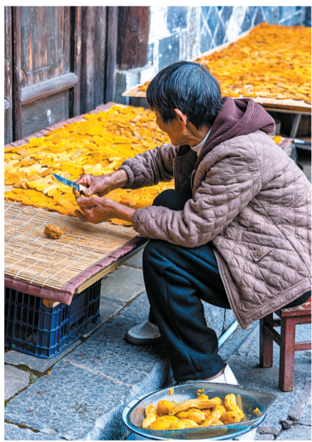
烟火人间 佳能R5,ISO-320,f/5.6,1/200秒

检修人躬身转于深处,眼手相合,凝神细勘。以毫厘初心守安全,凭极致严谨护机组,每一次细致巡检,都是献给能源保供最美的匠心答卷。