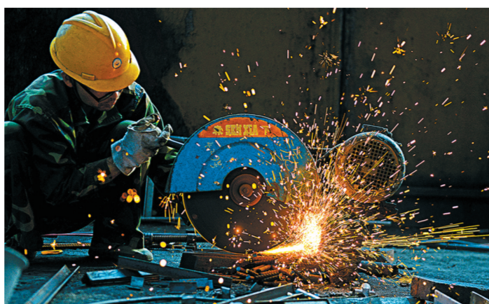
火树银花 尼康D800,ISO800,f/2.8, 1/250秒

古村街巷,烟火生息。老者晒物藏暖意,朝夕相守老手艺。一双手、一方土,便是人间最温柔的岁月绵长。