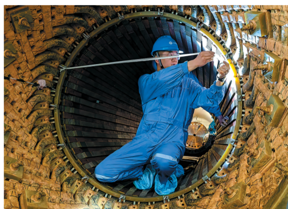
匠人·匠芯

暖阳洒满农家小院,老人低头剥着油茶果,收获的喜悦从满脸褶皱和缺齿的笑容里倾泻而出,比阳光更暖。