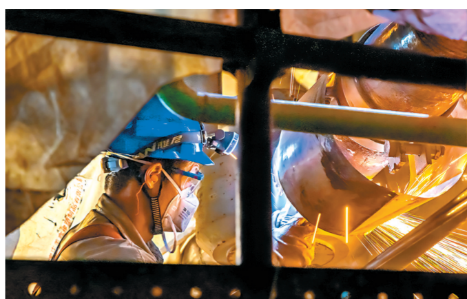
焊缝如诗 佳能R5,ISO1500,f/4, 1/250秒

每一束灼灼焊花,皆由汗水浸润淬炼,化作熠熠微光,奏响劳动者扎根平凡岗位,默默奉献的动人乐章。