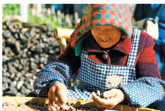
收获喜悦

约稿:下期《视觉影像》拟推出“雅趣流年”摄影专辑。截稿日期5月25日,望广大摄影爱好者踊跃投稿,来稿需提供设备型号、光圈、速度、感光度、拍摄模式等基本信息及百字以内拍摄体会。投稿邮箱:290795251@qq.com,来稿请注明姓名、单位和联系方式。