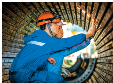
检修手记 尼康D810,ISO100,f/2.8,1/100秒

他们是筒仓里的守护者、脚手架上的攀援者、田垄间的播种者、操作台前的雕琢手……工装沾着同样的热忱,让钢壁、稻穗、零件都闪烁微光。当亿万双手咬合时代齿轮,千万束光便汇作星河,照亮每个拼搏的日子——这,就是劳动者的力量。