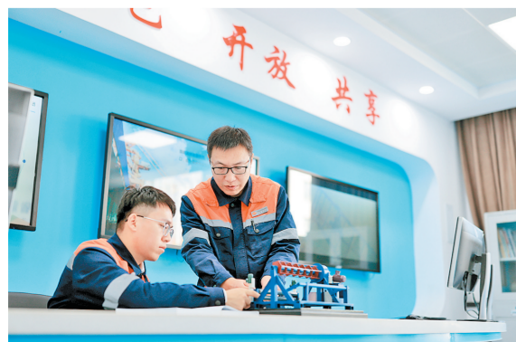
科技创新,智引航向。