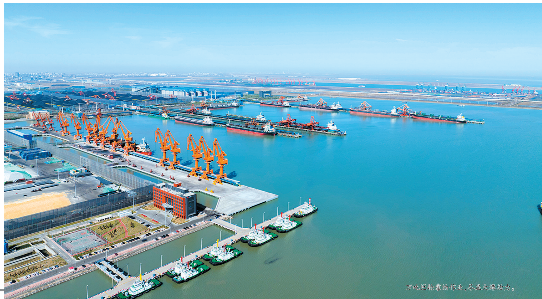
万地巨轮靠泊作业,尽显大港魅力。