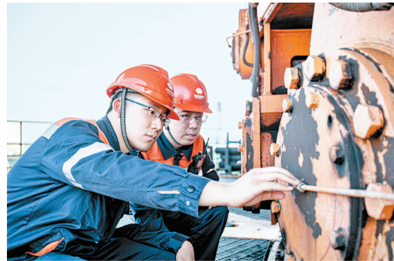
精检细修,筑牢防线。