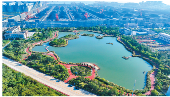
港区生态公园绿意盎然。

水资源循环利用、抑尘技术革新……一系列环保技术相继落地,让“绿色”成为港口高质量发展的鲜明底色,也让“煤港”真正变成了人人称赞的“美港”。