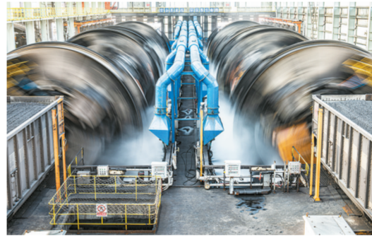
翻卸作业实现无尘化。