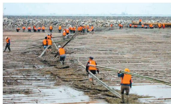
吹填建陆,筑港起步。

火热的施工现场、繁忙的生产场景,无不彰显着黄骅港人打造世界一流港口的决心与担当。