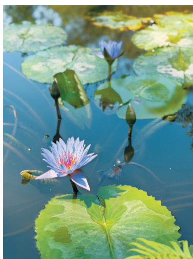
清池莲语

苹果17ProMax, ISO64, f/1.78, 1/1085秒 春水初生,漫过青石浅岸,紫莲凝着晨露,立于清波之上。层层紫瓣次第舒展,在粼粼波光里悄然绽放。