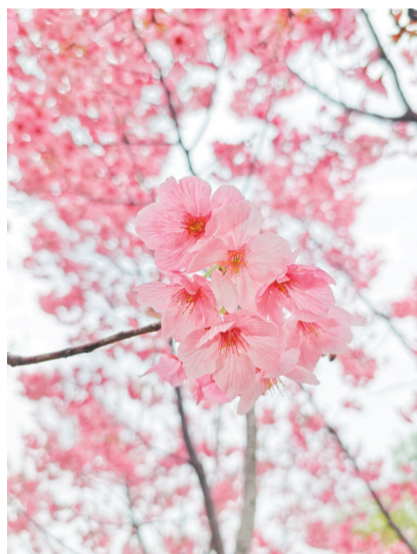
红梅报春

苹果17ProMax, ISO64, f/1.78, 1/1085秒 春水初生,漫过青石浅岸,紫莲凝着晨露,立于清波之上。层层紫瓣次第舒展,在粼粼波光里悄然绽放。