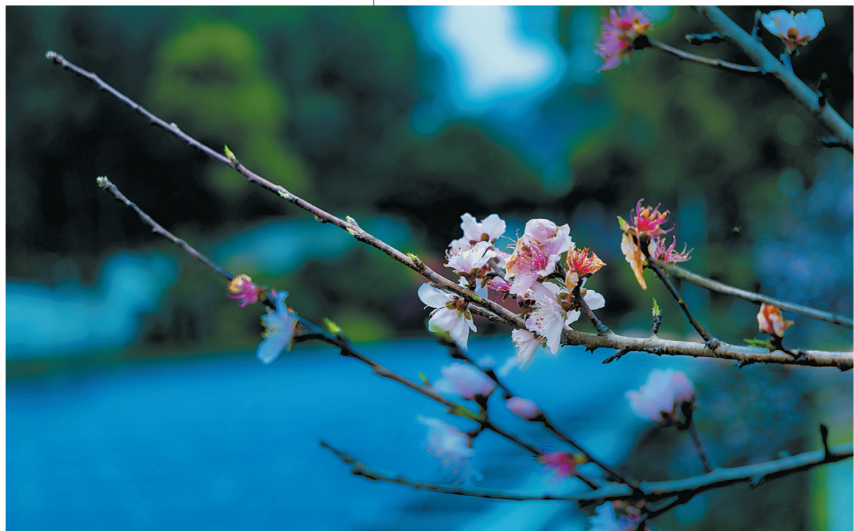
一枝春信

黄绿交织的田野间,农人轻沐和风,把辛勤耕耘的身影融进明媚春光,让希望随新芽一同拔节生长。