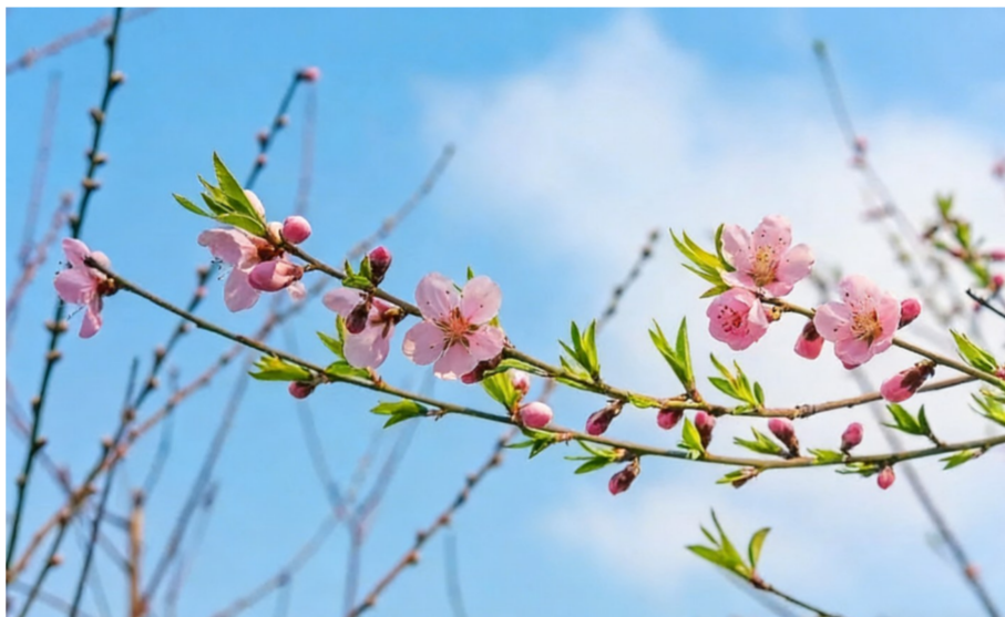
醉春风 苹果13, ISO20, f/1.6, 1/4854秒

柔枝舒展,白花轻绽,在朦胧绿意间缱绻生香、轻铺春意。它不与繁花争艳,只在枯瘦枝丫上绽放出几朵欲语还休的浅白,在风中轻颤,俏到极处。