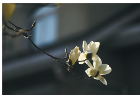
玉色生香

索尼A7C2, ISO100, f/1.8, 1/1250秒 早春的风栖湖,满树的粉梅绽放,花朵层层叠叠,有的已然盛放,露出纤柔的花蕊,有的还裹着花苞欲语还休,远看像大片粉云漫过天边。